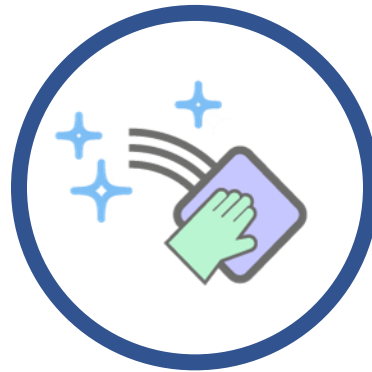
SANITIZAÇÃO DOS AMBIENTES